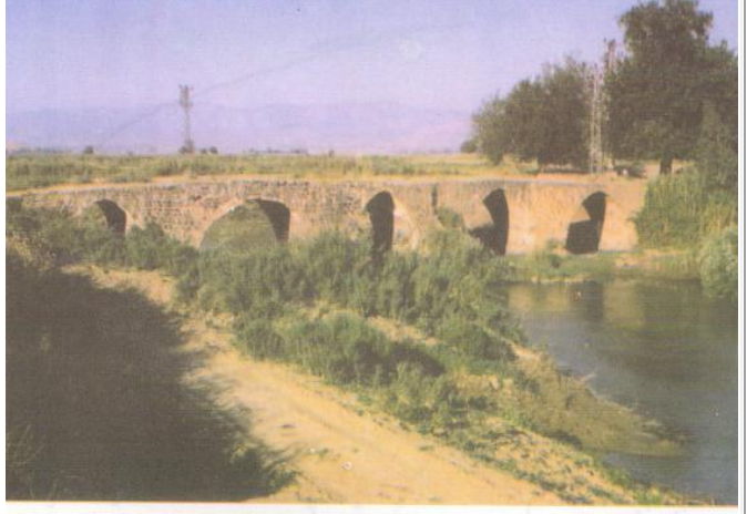
Resim 13. Taş Köprü (Dana Ahmetli Köyü, 16. yüzyılda yapıldığı sanılmaktadır.)

Kırıkhan'da, Karasu Nehri üzerinde altı gözlü bir taş köprüdür. Köprü'nün 16. yüzyıla ait olduğu sanılmaktadır. Eski yıllarda Ceylanlı Köyünden gelip Halep'e giden yol üstünde kurulan köprü, halen ayakta ve sağlam olarak kullanılmaktadır. Halk arasında Taş Köprü adıyla bilinen köprü'nün, yörede yaşamış olan "bir aşiret reisinin hanımı" tarafından yaptırıldığına dair söylenti vardır.