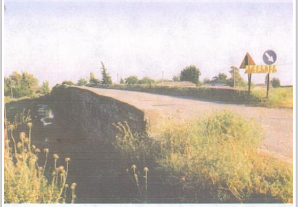
Resim 12. Murat Paşa Köprüsü (1607 yılında Kuyucu Murat Paşa tarafından yaptırılmıştır.)

Baldıran Höyüğü yakınlarındadır. 200 metre aralıkla yapılmış 2 köprü bütünüdür. Büyük olan köprü 16 gözlüdür. Yüksek olmayan ve 3 metre genişliğindeki köprülerin kırkulukalı hemen hemen ortadan kalkmıştır. Kesme taştan yapılan iki köprüden uzun olanının bir yol yapımı sırasında asfaltın altında kalmıştır. Muhtemelen 4. Murat'ın Padişahlığı sırasında çıktığı Bağdat seferi için yapılan köprülerin yapım tarihinin 1636-37 olması gerekmektedir. Halk arasında Murat Paşa Köprüleri olarak anılması da bu görüşe doğrulamaktadır.