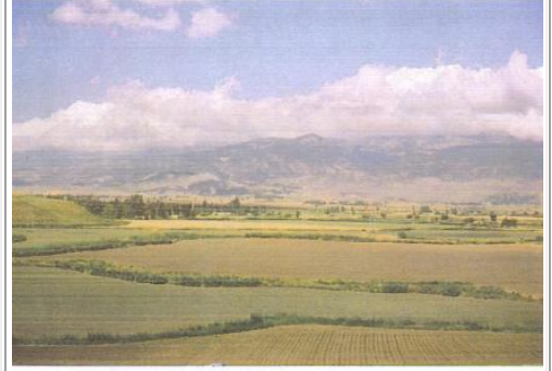
Resim 11. Amanos Dağları (ova, höyük, dağ görünümü).

Torosların bir kolu olan Amanoslar, kuzey güney yönünde Hatay topraklarına uzanmaktadır. Amanosların Ceyhan Nehrinin dağı geçtiği bölümden Belen Geçidi'ne kadarki bölümüne Gâvur Dağları denmektedir. Belen Geçidinden Antakya'ya uzanan bölümse, Kızıldağ olarak bilinir. Rafik Halid Karay'ın aynı adlı eserinde, Amanoslara da geniş yer verilir.