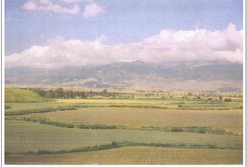
Resim 11. Amanos Dağları (ova, höyük, dağ görünümü).

Torosların bir kolu olan Amanoslar, kuzey güney yönünde Hatay topraklarına uzanmaktadır. Amanosların Ceyhan Nehrinin dağı geçtiği bölümden Belen Geçidi'ne kadarki bölümüne Gâvur Dağları denmektedir. Belen Geçidinden Antakya'ya uzanan bölümse, Kızıldağ olarak bilinir. Rafik Halid Karay'ın aynı adlı eserinde, Amanoslara da geniş yer verilir.